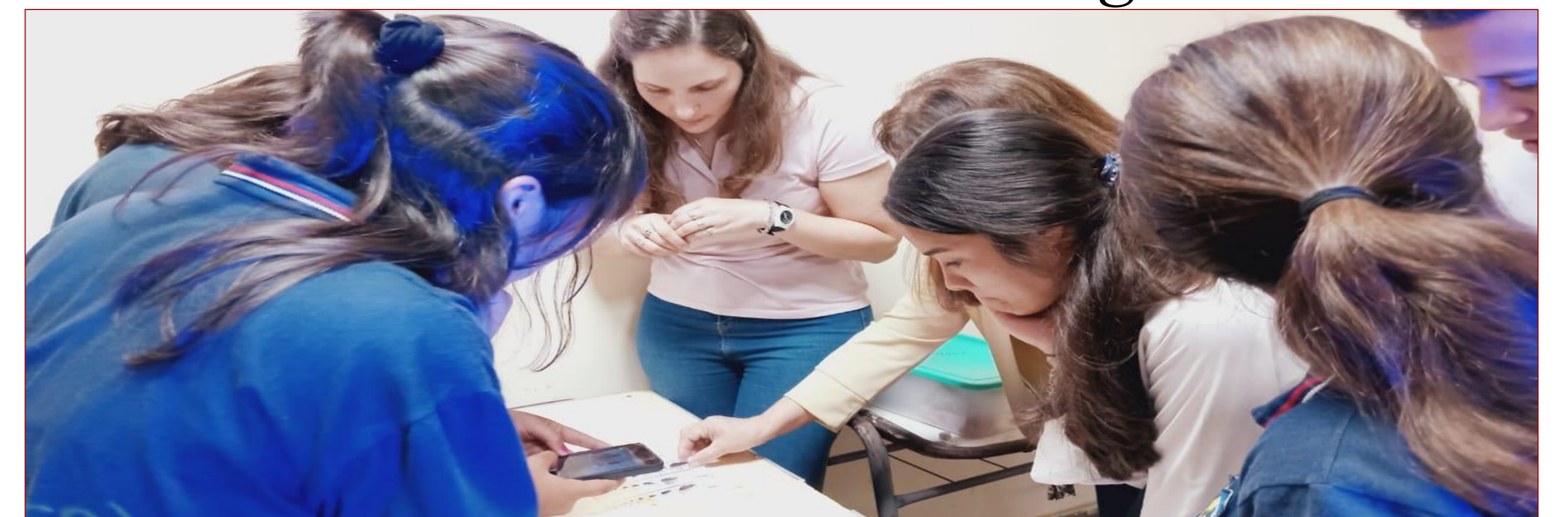
Observación de material entomológico

Conclusiones: Se logró despertar el interés de una población de jóvenes de gran dinamismo como impulsores de la información de ¡Misión Chagas! Para dar continuidad a la actividad se propone extender los talleres hacia el interior de la provincia de Misiones.