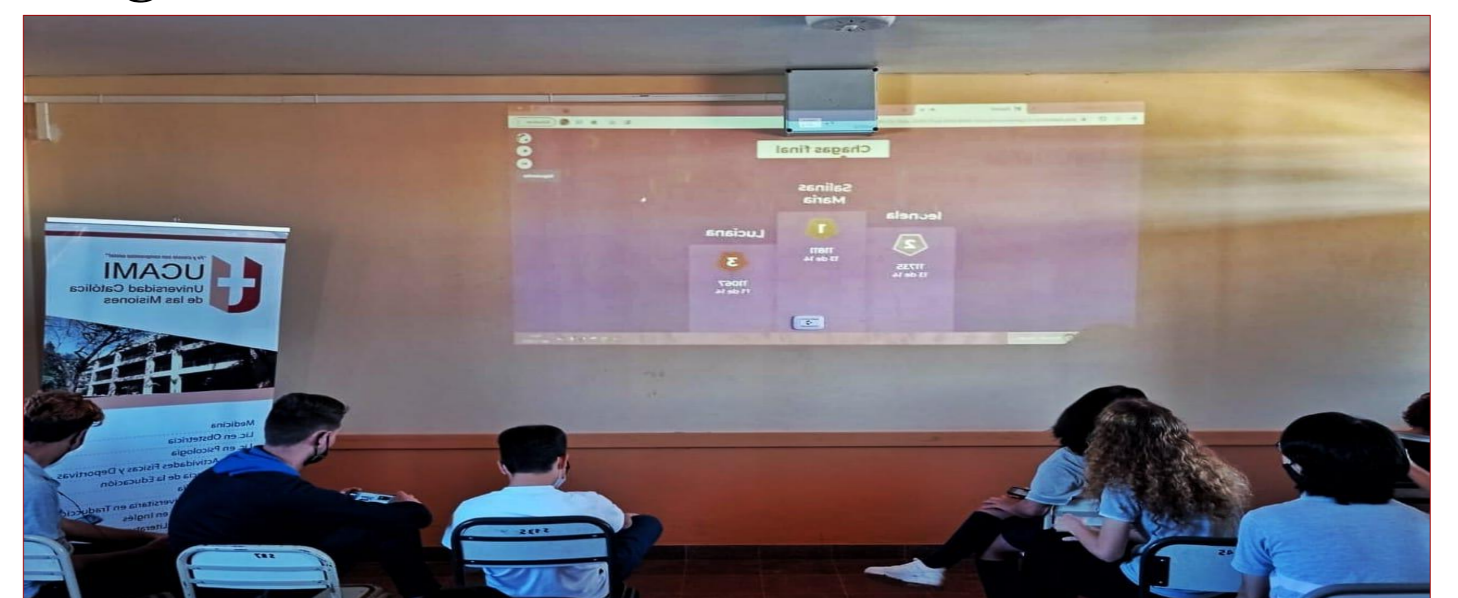
Preguntas online a través de "Kahoot"